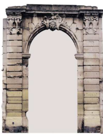
Portail du château du Marais

Propriété des bénédictins d'Argenteuil depuis le Moyen Âge, le domaine du Marais s'étend depuis les bords de Seine jusqu'au Val-Notre-Dame.